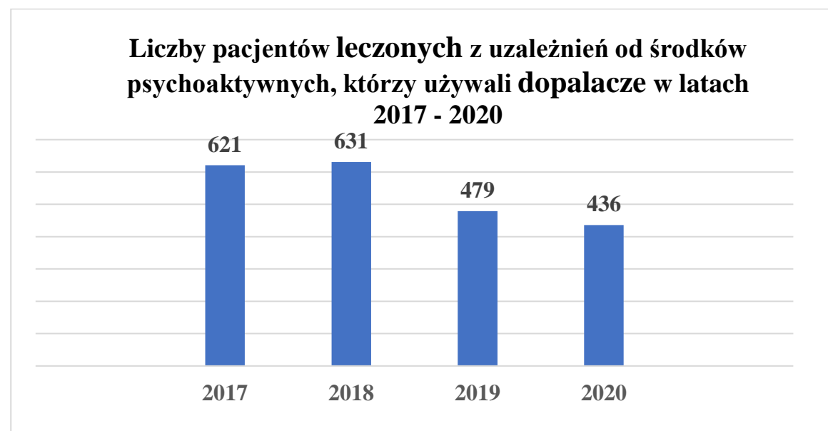
Rysunek 2. Liczby pacjentów leczonych w podmiotach leczniczych woj. podkarpackiego z uzależnień od substancji psychoaktywnych (F 11 - F 19), którzy stosowali dopalacze (2017 - 2020).