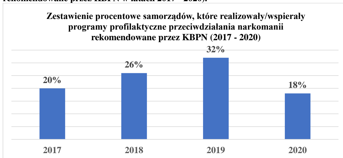
Rysunek 3. Wykaz procentowy samorządów gminnych, które realizowały/wspierały programy profilaktyczne przeciwdziałania narkomanii rekomendowane przez KBPN w latach 2017 - 2020).