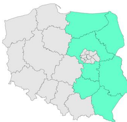
Mapa: 6 regionów statystycznych Wschodniej Polski