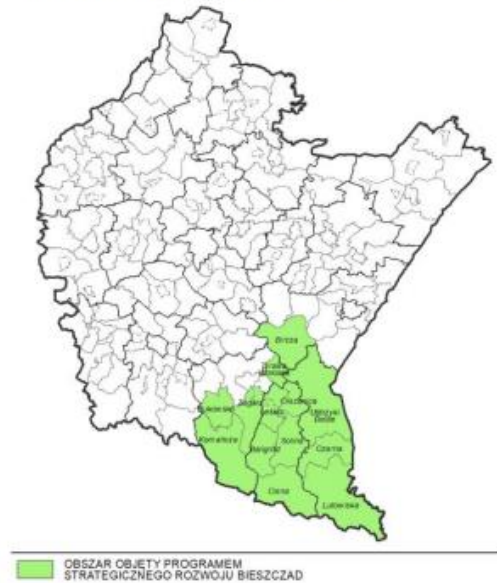
Mapa 19. Obszar objęty Programem Strategicznego Rozwoju Bieszczad