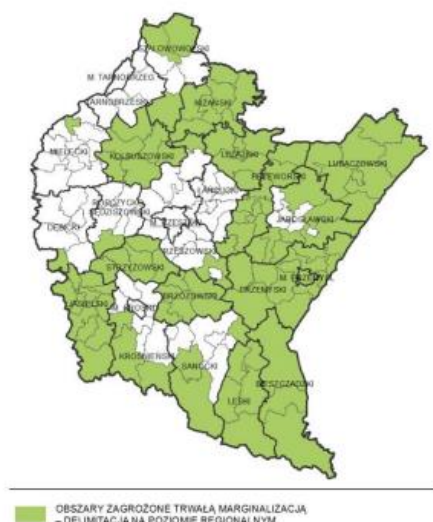
Mapa 18. Obszary zagrożone trwałą marginalizacją – poziom regionalny

Źródło: opracowanie własne PBPP w Rzeszowie.