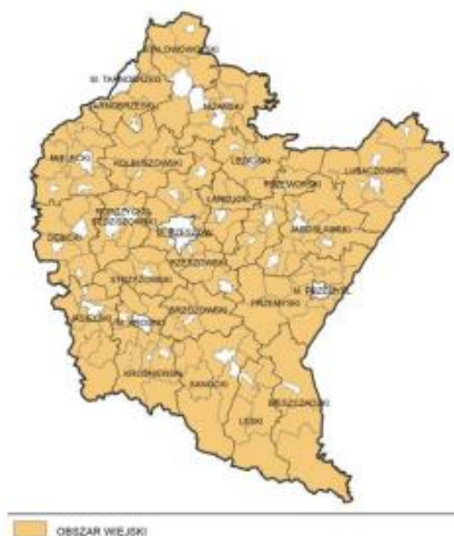
Mapa 21. Obszary wiejskie województwa podkarpackiego